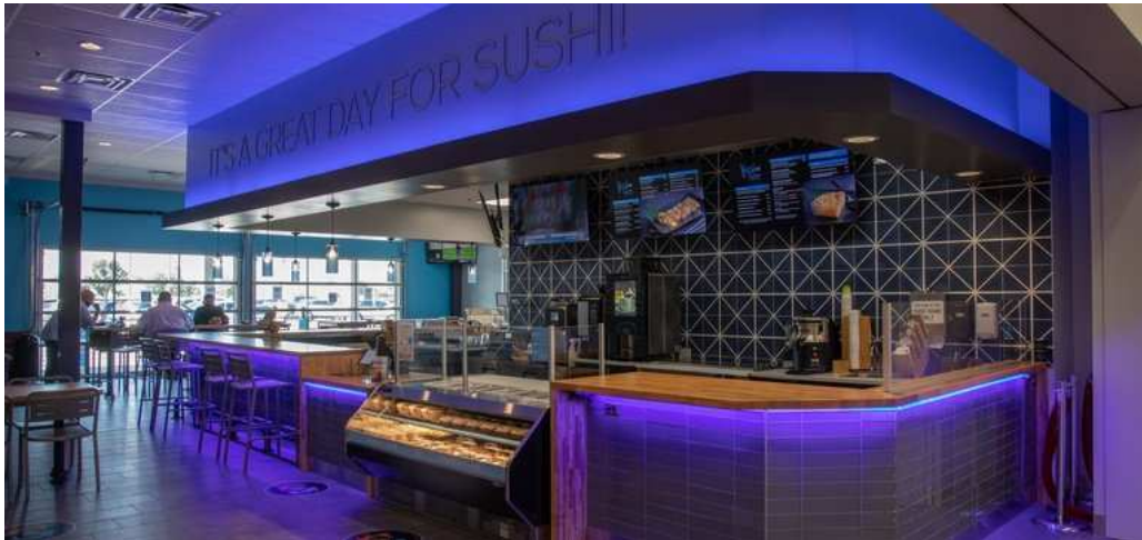
▲ “Hissho Sushi & Craft Beer Bar”高級感を感じます。

“Hissho Sushi & Craft Beer Bar”と名付けられたこのグロサラントでは熟練の寿司シェフによる握りや手巻きだけではなく、点心や手羽先なども含む出来立ての総菜なども提供しております。