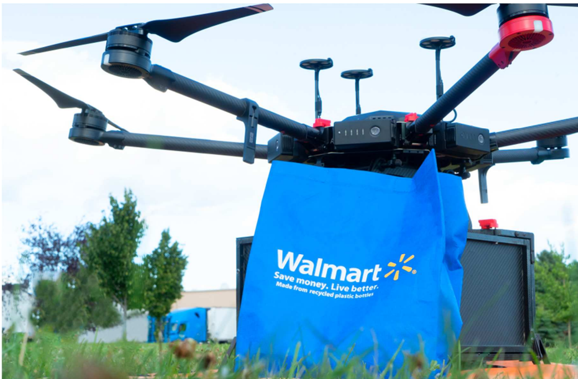
▲ドローンを利用した宅配サービス

直近のニュースでは10月1日に Walmart の幹部と起業家を繋ぎ、ビジネスのチャンス共有できる Open Call という名称の初リモートによるイベントを開催する予定です。